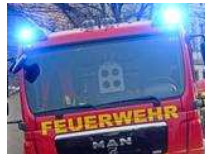
Unbeaufsichtigter Grill: Feuer schlägt über