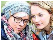
Elas letzter Wille ist ihr Vermächtnis