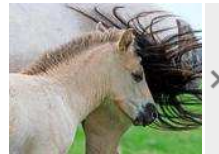
Pferdekrankheit Druse breitet sich weiter aus